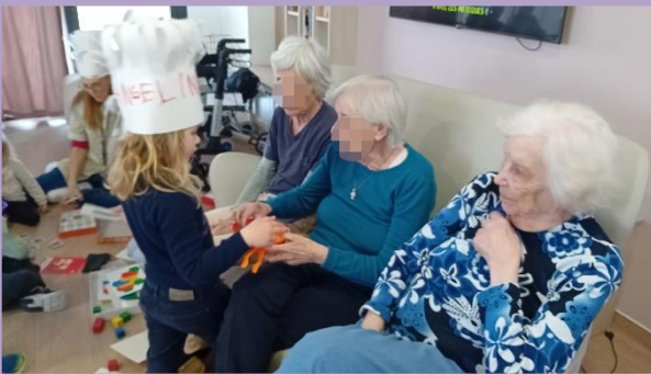
Un moment de partage avec les enfants...

Certains résidents ont prêté main-forte pour la préparation de pommes, d'autres ont préféré attendre sagement !