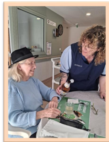
Dégustation de la bière d'Irlande, avec modération bien sûr !