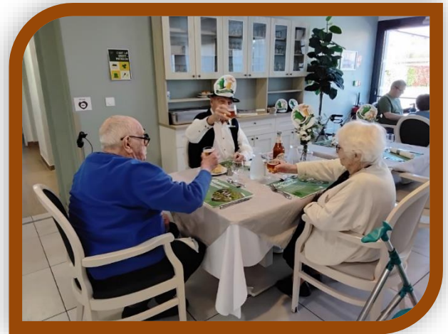
A la vôtre messieurs- dames !