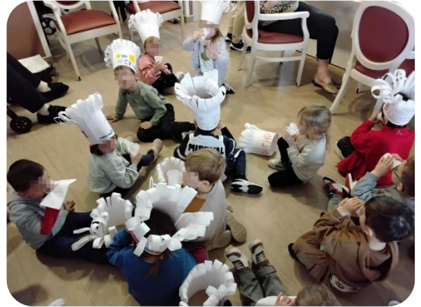
Les petits chefs se désaltèrent après un dur labeur !